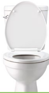
Ir al baño