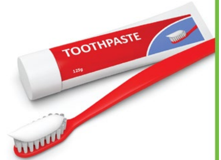
Lavarse los dientes