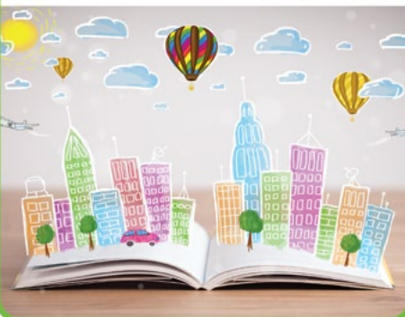
Leer un cuento